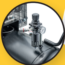
Vanne de régulation de pression