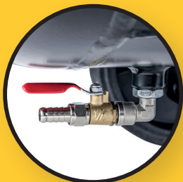
Robinet de vidange pour la condensation