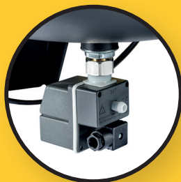
Robinet de vidange automatique pour la condensation