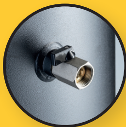
Raccord direct côté chaudière