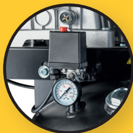
Manomètre de pression Pressostat Condor plus