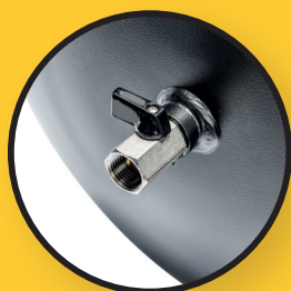
Raccordement direct côté chaudière