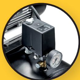
Indicateur de pression + pressostat Condor