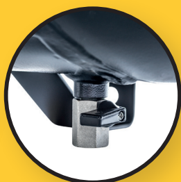
Robinet de vidange pour la condensation